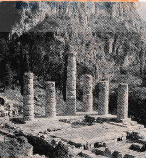
Templul lui Apollo din Delfi, pe frontispiciul căruia scria „Cunoaște-te pe tine însuți”

Apreciind că raționalismul și empirismul, considerate în sine, nu oferă o cunoaștere adecvată a naturii umane, Immanuel Kant sintetiza cele două teorii astfel: dacă prin latura sa corporală, omul se manifestă ca ființă cu înclinații biologice, deci egoiste, prin cea spirituală, el se manifestă ca ființă morală. În viziunea filosofului german, nu vom ști ce este omul dacă, mai întâi, nu ne întrebăm: Ce poate să știe? Ce trebuie să facă? Ce poate să spered? Metafizica, morală, religia oferă în ultima instanță răspunsurile