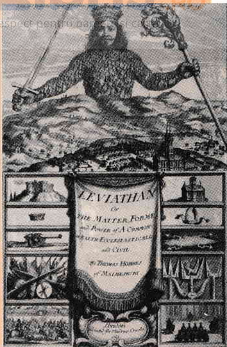
Prima pagină a lucrării lui Thomas Hobbes Leviathan (ediția întâi)

Societatea poate fi comparată cu o mașinărie enormă, ținută în funcțiune prin participarea a nenumărate persoane (...). Individul este un instrument al societății, nu organul care participă conștient la crearea ei.