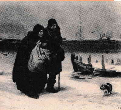
Viktor Vasnetov (1848-1926), Plecarea de acasă

Fiecare persoană deține în sine unitatea prin relația sa cu ceilalți, nu mai puțin prin relația cu sine însăși.